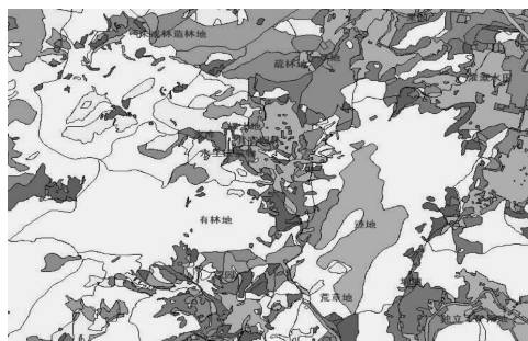
图 2 龙海市土地利用矢量图

以 2002 年龙海市土地利用覆盖图层 (coverage 格式如图 2) 为实例, 利用基于概念书的空间关联规则挖掘方法进行空间数据挖掘。本研究没有考虑土地利用变化情况, 而目的在于挖掘出土地利用类型空间上的关系, 即挖掘出八大类土地利用类型之间的空间关联规则。龙海市土地分类主要包括八大类 (耕地、园地、林地、牧草地、居民及工矿用地、交通用