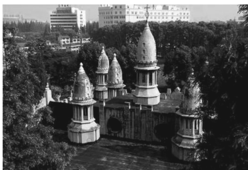
图5 古德寺的自然环境