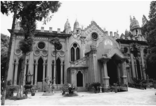
图 3 圆通宝殿

目前古德寺内具有较高文物保护价值的建筑只有圆通宝殿(图 3)。该大殿是寺庙的中心建筑,其余建筑均为近期新建。例如,天王殿就是一座中式硬山单坡顶建筑,由于年久失修,现在的建筑外形特征非常简洁朴素,但是作为寺庙整体建筑群的一部分,同样表现出了一定的艺术魅力。