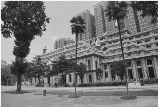
图 2 古德寺周边建筑

地扩张带来的影响,寺庙园林外部及内部空间不断被压缩,除了历史建筑空间以外,寺庙园林绿色公共空间大面积减少。绿色公共空间往往是交往空间的载体,有利于互动活动和文化活动的展开,绿色公共空间的缺失对于朝圣活动的展开及交往活动的进行造成明显的影响。