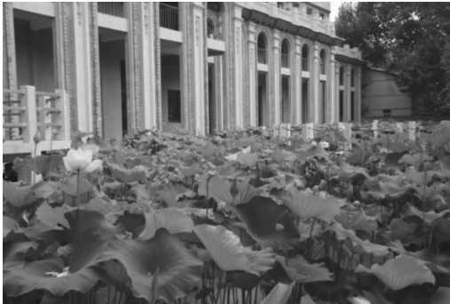
图 4 古德寺荷花池

寺庙园林是通过自然山水环境、传统宗教建筑和园林植物景观来表达人们的精神寄托和需求。古德寺是一座具有百余年历史的佛教寺庙,其院落空间布局中轴对称、庄严而神圣,园林空间则清新淡雅,寺庙建筑与周围环境的关系比较协调。寺庙园林除了具备宗教信仰的功能需求,还应该加强其观赏与游憩等功能的需求。旧时的古德寺建筑格局是三进院落式,中轴对称布局;在园林空间组织上也有着明显的景观序列,并且采取打破陈规、自由灵活的方式,打破了宗教空间的森严沉闷。在庭院空间中的植物造景则加强内外空间的联系,增强空间的活力。例如,荷花池代表着宗教的圣洁(图 4);各种四季常绿植物、古树名木象征宗教的万古长青等(图 5)。